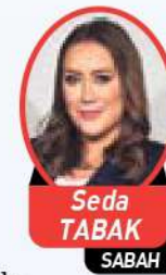
Seda TABAK SABAH

Projeyi öne çıkaran bir başka nokta ise ulaşım kolaylığı. Yeni Levent projesi, Türkiye'nin en büyük şirketlerinin genel merkezlerine, İstinye Park, Kanyon, Akmerkez ve Zorlu AVM gibi alışveriş merkezlerine, İTÜ ve Boğaziçi gibi eğitim kurumlarına, aynı anda