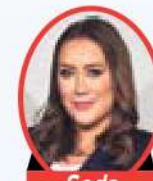
Seda TABAK SABAH

Projeyi öne çıkaran bir başka nokta ise ulaşım kolaylığı. Yeni Levent projesi, Türkiye'nin en büyük şirketlerinin genel merkezlerine, İstinye Park, Kanyon, Akmerkez ve Zorlu AVM gibi alışveriş merkezlerine, İTÜ ve Boğaziçi gibi eğitim kurumlarına, aynı anda